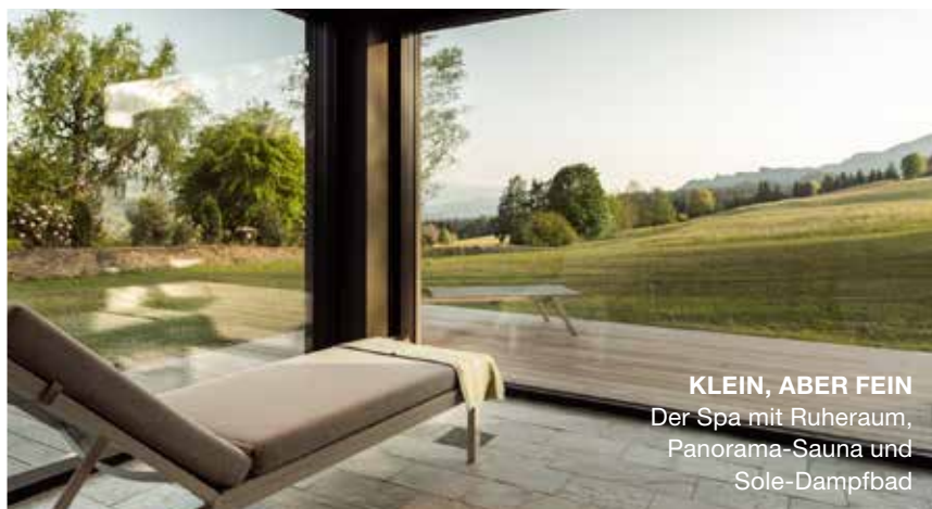
KLEIN, ABER FEIN Der Spa mit Ruheraum, Panorama-Sauna und Sole-Dampfbad