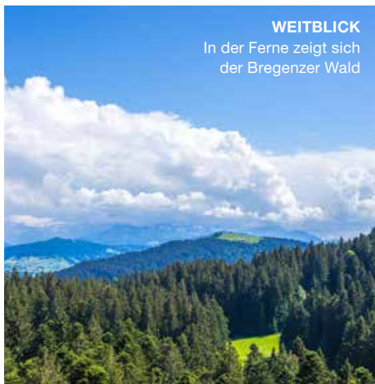
WEITBLICK In der Ferne zeigt sich der Bregenzer Wald