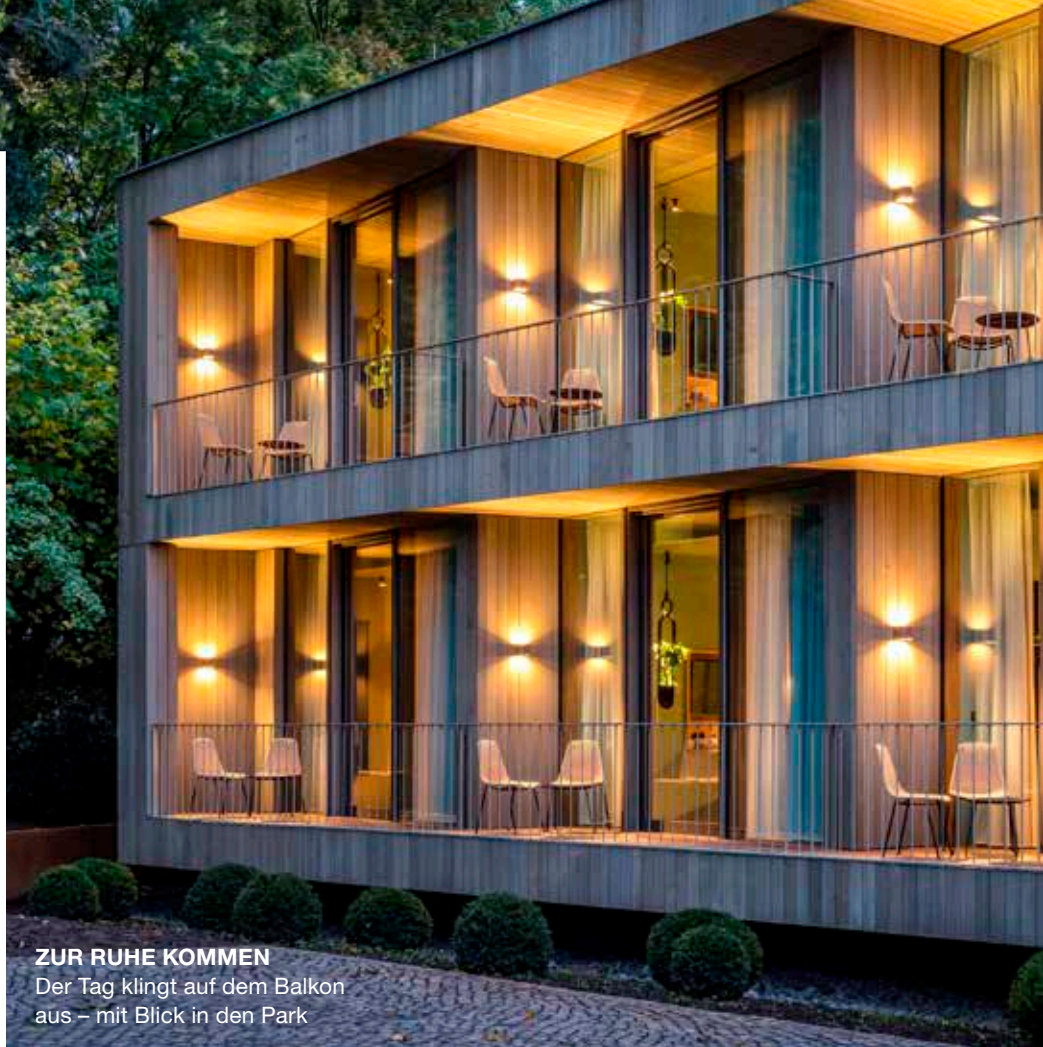
ZUR RUHE KOMMEN Der Tag klingt auf dem Balkon aus – mit Blick in den Park

SAARLOUIS Plant man einen Wanderurlaub, denkt man wahrscheinlich eher an Bayern als ans Saarland. Dabei gibt es im Landkreis Saarlouis jede Menge Wandermöglichkeiten, etwa zur Teufelsburg hinauf oder auf den 414 Meter hohen Gipfel des Littermont. Auf ihn gelangt man über felsiges Vulkangestein, enge Waldpfade und hügelige Streuobstwiesen. Wunderbarer Ausgangspunkt für solche Touren ist das Designhotel „La Maison“ in der Nähe zur Innenstadt von Saarlouis. Das Vier-Sterne-Superior-Hotel besteht aus einer Villa aus dem 19. Jahrhundert und zwei modernen Anbauten inmitten einer gepflegten Parkanlage. Innen fühlt man sich – sowohl was die stilvolle Einrichtung wie die Küche anbelangt – nach Frankreich versetzt. Gourmets kommen im Restaurant „Louis“ voll auf ihre Kosten. Es hat einen Michelin-Stern. INFOS 1 Ü/F im DZ ab 105 Euro p.P., lamaison-hotel.de .