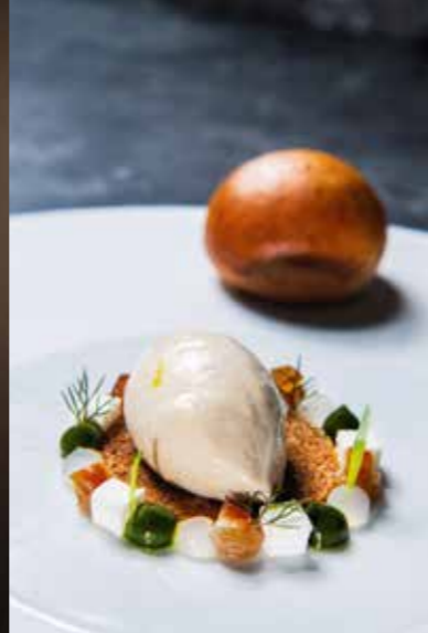
Links: Silio Del Fabro bietet sowohl Gourmetküche als auch zwangloses Soulfood an. Oben: Foie gras glacé mit Schafskäse, Estragon, Dattel und Brioche im Restaurant „Atama“ in St. Ingbert