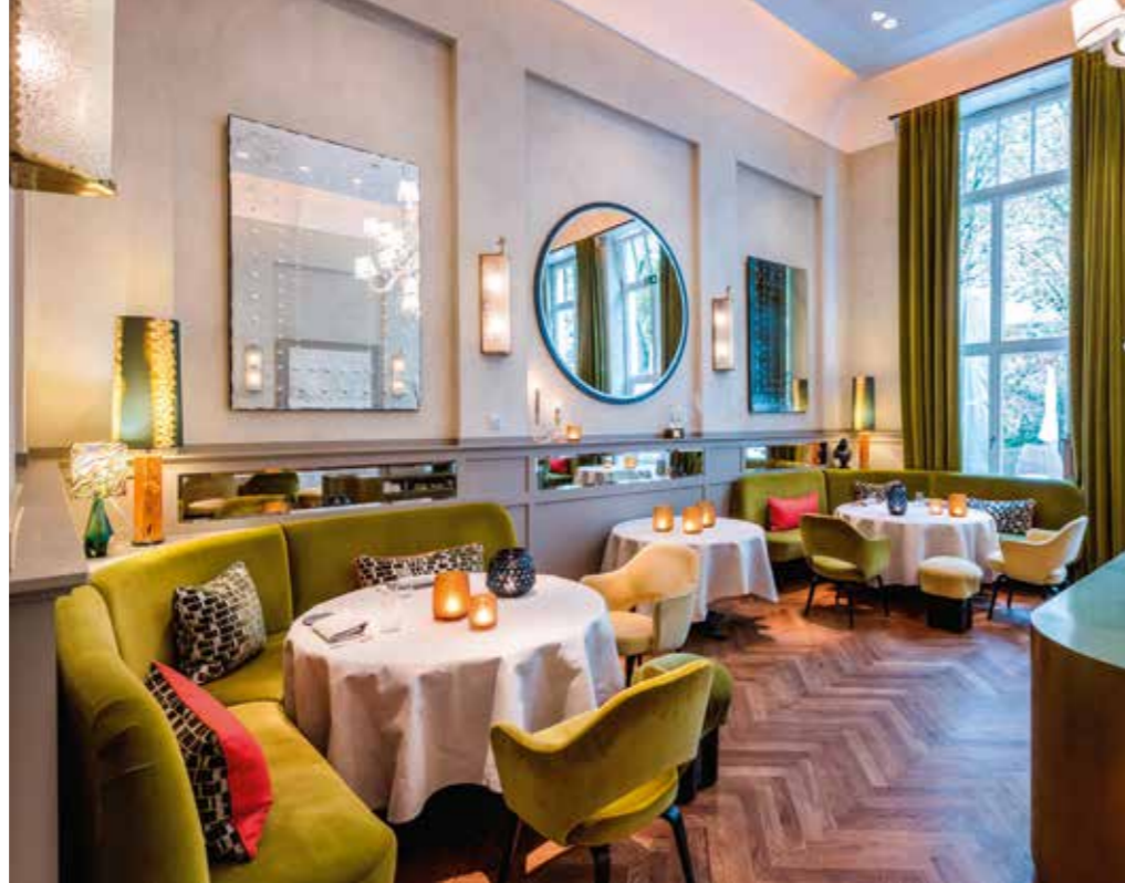
Im wunderschönen „Louis“ (o.) in Saarlouis kocht der brillante Sebastian Sandor. Rechts davon: das Hotel „Esplanade“ in Saarbrücken, wo es im „Le Petit Cinq“ Gerichte wie geflammten Lachs gibt

„Buchnas Dorfküche“: Ein zeitgemäß geführtes Gasthaus ganz in der Nähe der Saarschleife. Sandor empfiehlt die Rehaultaschen auf Apfelweinsauerkraut mit Apfelbalsamico-Wildjus. www.hotel-saarschleife.de